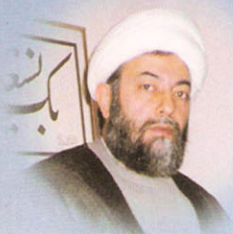
آية الله الشيخ محمد صادق الكرباسي